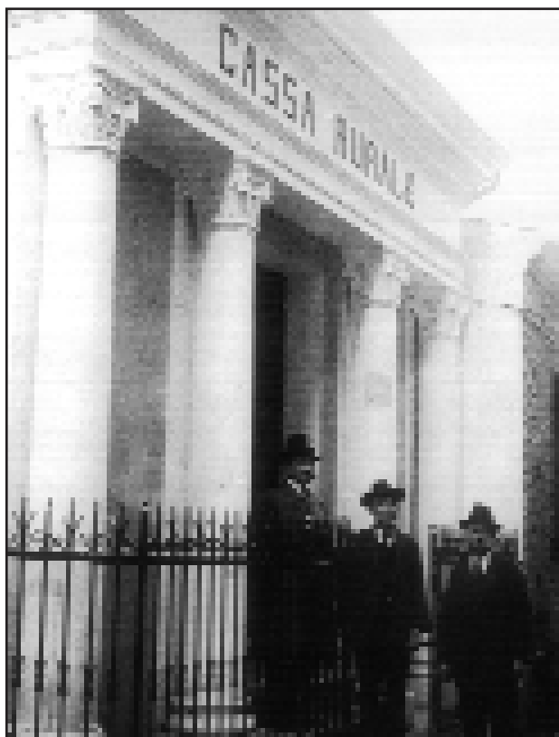
UNA FOTO STORICA DELLA FILIALE DI BISIGNANO