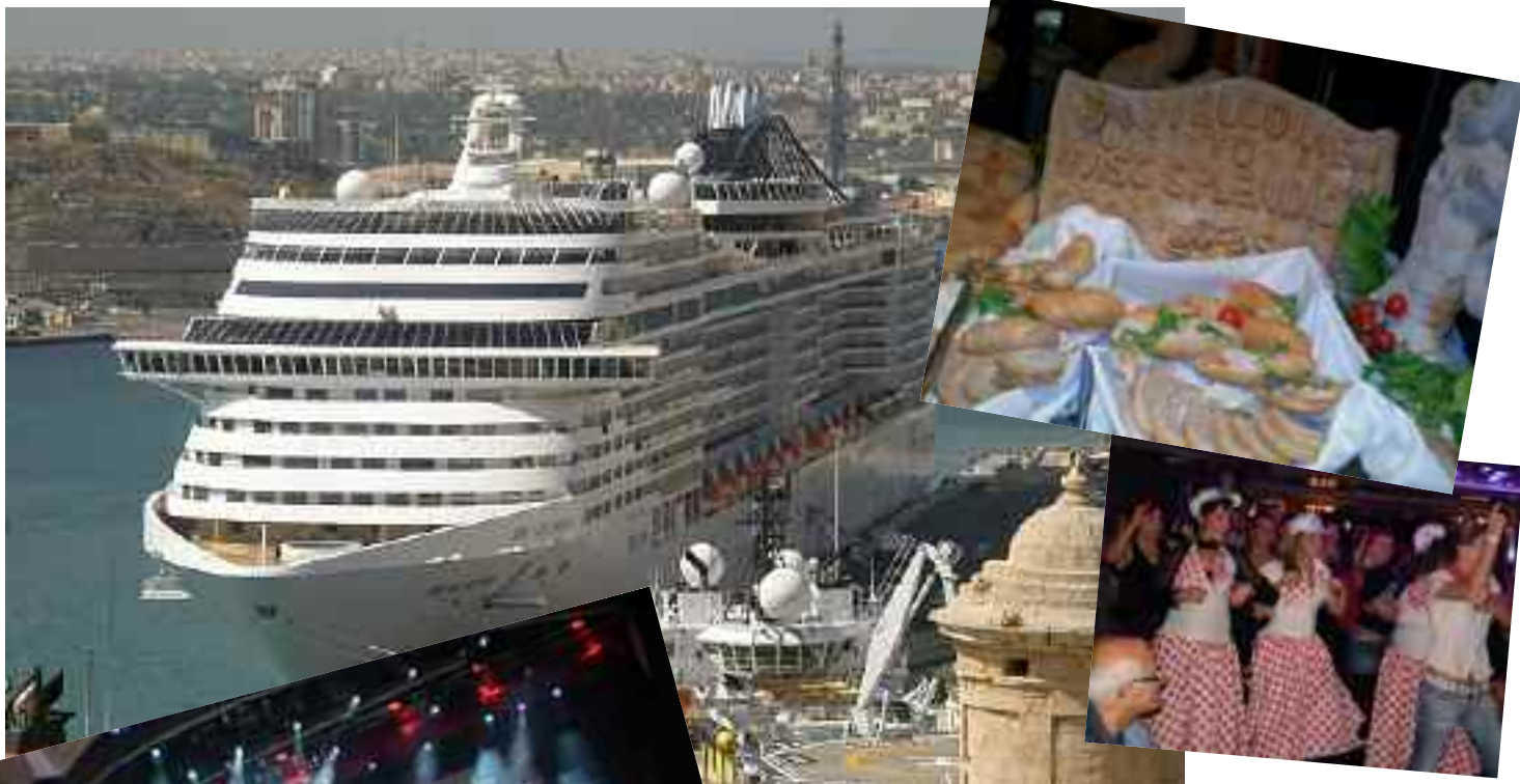
La MSC Splendida giganteggia nel porto di La Valletta. Nei riquadri alcune immagini della crociera.

Rientrando a casa inizia il tempo dei consuntivi. La crociera Splendida si è tradotta, operativamente, in una settimana ricca di impegni e di cose da fare. Non tutti sono riusciti a fare tutto, ma