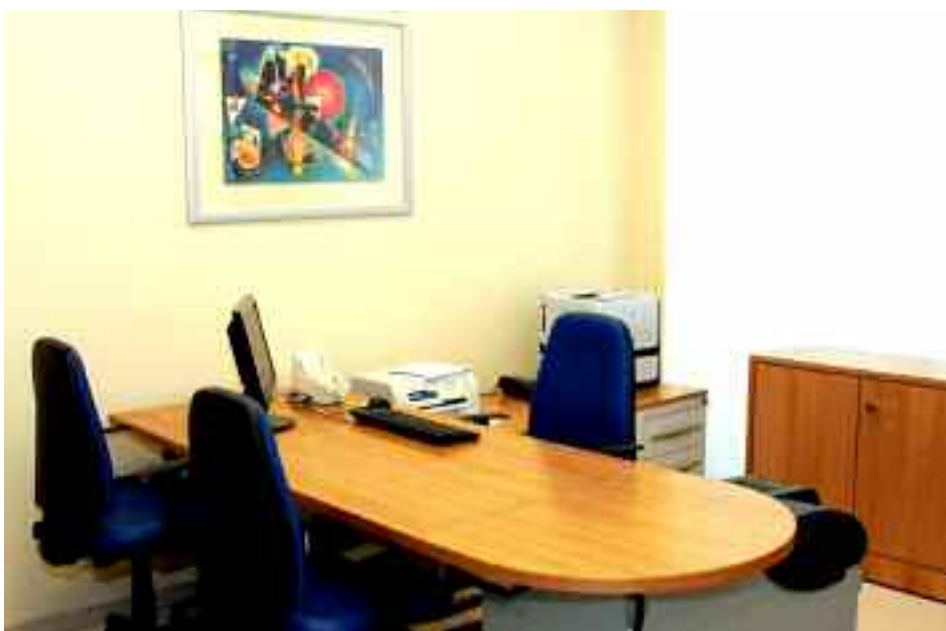
A sinistra il bancomat della filiale, a destra l'interno di uno degli uffici di cui è dotata la sede di Paola.

La mattina del 30 settembre 2009 c'era tanta gente nel piazzale di Via del Cannone, a Paola. La BCC Mediocrati apriva la sua nuova filiale e tantissimi soci hanno voluto accogliere le autorità politiche e creditizie presenti per l'occasione.